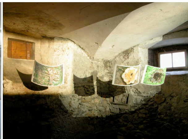
Bergheimat (Silke Maier)