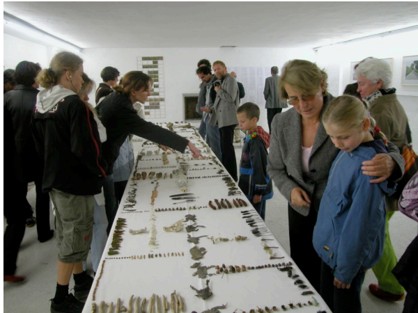
Bergheimat - Besucher